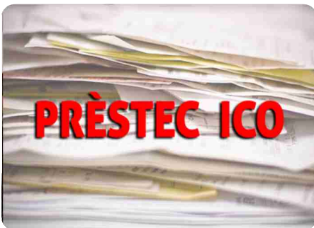
EU vol que els ingressos vagen als proveïdors